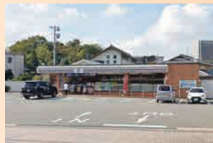
セブンイレブン…徒歩7分