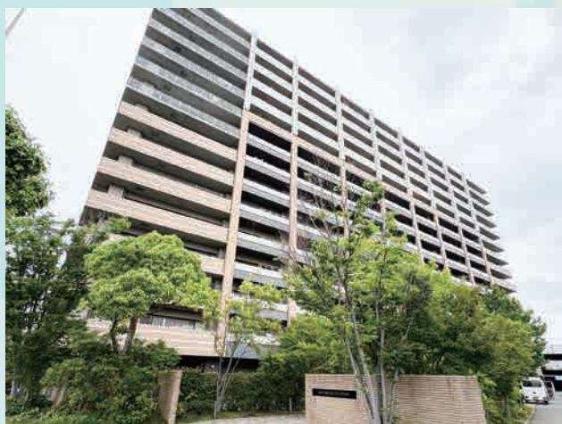
緑豊かなアプローチ

最上階 角部屋！専有面積 59.98 m 2 ゆとりの2LDK 登場！ 地下鉄福岡空港駅迄徒歩圏内！周辺には買物施設充実！