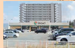
マルシヨク…徒歩6分