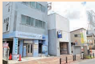
地下鉄空港線「福岡空港駅」