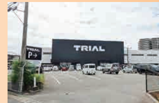
スーパーセンタートライアル