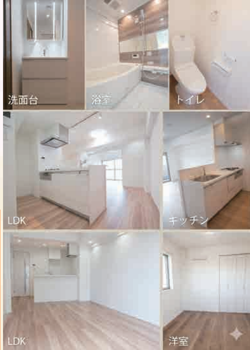
※リフォーム完成予想図

2026年9月下旬リフォーム完了予定です！ 角部屋2面バルコニー！南向き☆日当たり良好♪