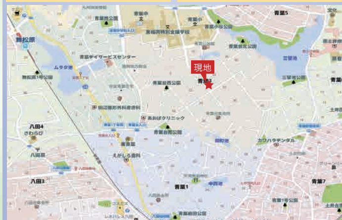
福岡市東区青葉三丁目 33 番地