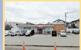
セブンイレブン青葉2丁目店 徒歩:8分