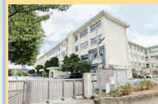
青葉小学校 徒歩4分