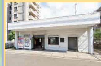
西鉄香椎線 舞松原駅 徒歩:16分