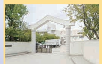
青葉中学校 徒歩6分