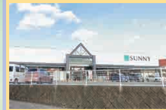
サニー舞松原店 徒歩16分