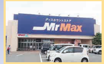
ミスターマックス土井店 徒歩17分