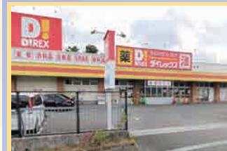
ダイレックス原店 徒歩11分