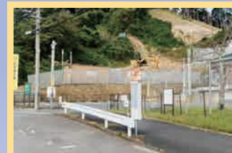
宮の森(西鉄バス) 停 徒歩:8分