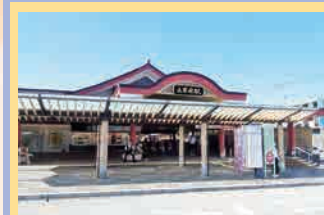
西鉄太宰府線 太宰府駅 徒歩:27分