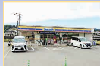
ミニストップ筑紫野原店 徒歩11分