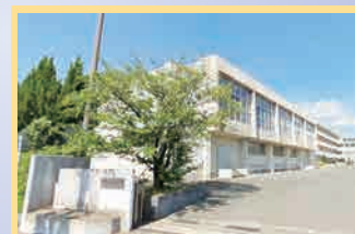
筑紫野中学校 徒歩60分