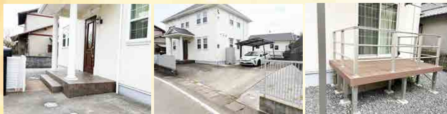
～内装後のイメージ画像～