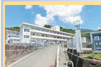
筑紫野市立吉木小学校 徒歩21分