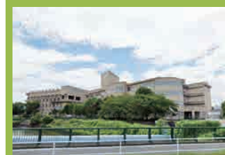
箱崎清松中学校 …徒歩10分