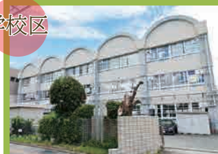
松島小学校 …徒歩12分