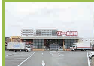
サトー食鮮館 …徒歩9分