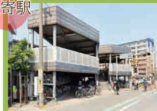
篠栗線「柚須」駅 …徒歩 23分