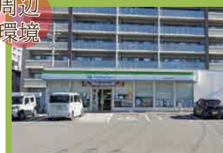
ファミリーマート …徒歩2分