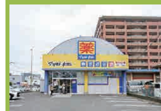
マツモトキヨシ …徒歩8分