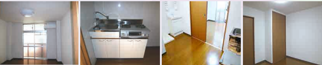
※室内写真は全て令和2年3月に撮影しております。