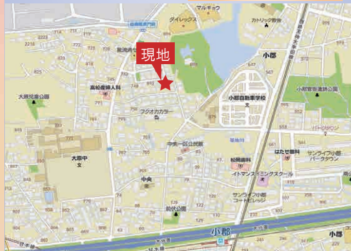
福岡県小郡市小郡 689 番地