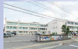
大原小学校 徒歩約 16 分