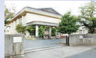
大原中学校 徒歩約 5 分