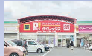
ダイレックス 徒歩約 4 分