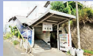
甘木鉄道「小郡駅」 徒歩約 8 分