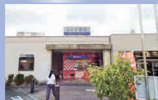
西鉄天神大牟田線「小郡」 徒歩約 11 分