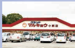
マルキョウ小郡店 徒歩約 5 分