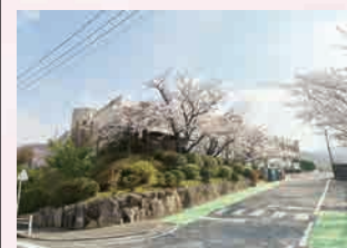
須恵第一小学校 …徒歩 11 分