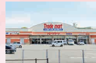
トレードマート …徒歩 12 分