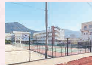
須恵中学校 …徒歩 12 分