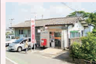
須恵郵便局 …徒歩 2 分