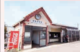
JR 香椎線「須恵中央駅」…徒歩 20 分