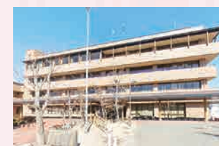
須恵町役場 …徒歩 17 分