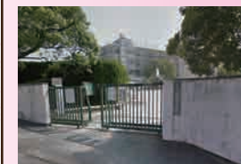
鶴田小学校 ... 徒歩7分