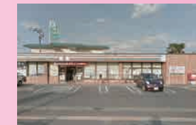
セブンイレブン鶴田4丁目店 ... 徒歩6分