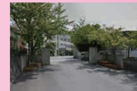
老司中学校 ... 徒歩14分