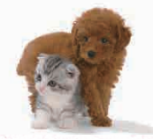
ペットも一緒に暮らせます