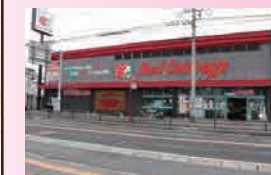
レッドキャベツ屋形原店 ... 徒歩8分