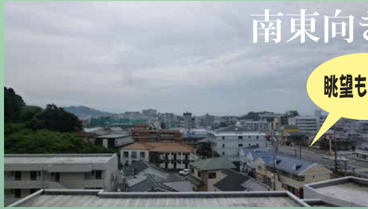
実際のお部屋からの眺望です