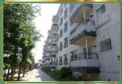
緑があふれるエントランス