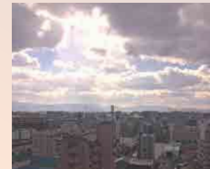
お部屋からの眺望