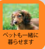
ペットと一緒に暮らせます